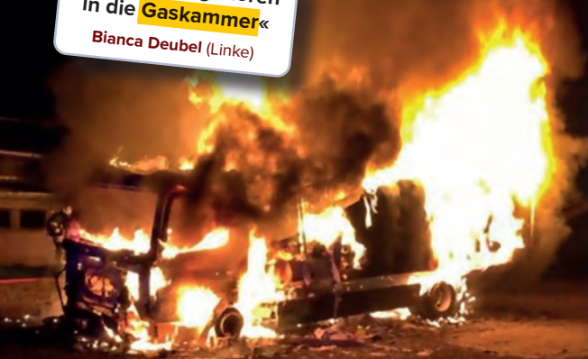
Brandanschlag auf ein Wahlkampffahrzeug der Thüringer AfD (Landtagswahlkampf 2019)