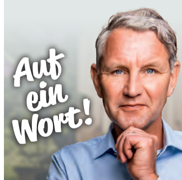
Kommentar von Björn Höcke

Der Lehrerberuf ist einer der schönsten Berufe der Welt. Denn was kann sinnstiftender sein, als dort tätig zu sein, wo man Kinder und Jugendliche auf dem Weg ins Leben unterstützen kann? Trotzdem fehlen Lehrer an allen Ecken und Enden: Ursachen sind die schlechte Stellenplanung, die millionenfache illegale Einwanderung, die die Schülerzahlen wachsen lässt, und das Unattraktivwerden des Lehrerberufes. Die Schule ist zur Reparaturanstalt der Gesellschaft verkommen, immer mehr verhaltensauffällige Kinder und solche, die der deutschen Sprache nicht mächtig sind, binden Kraft sowie Aufmerksamkeit der Lehrkräfte und hemmen den Unterrichtsgang. Die Schule muss entideologisiert und entbürokratisiert, die Familie gestärkt und die Remigration vorangetrieben werden, dann wird auch der Lehrerberuf perspektivisch wieder attraktiver werden!